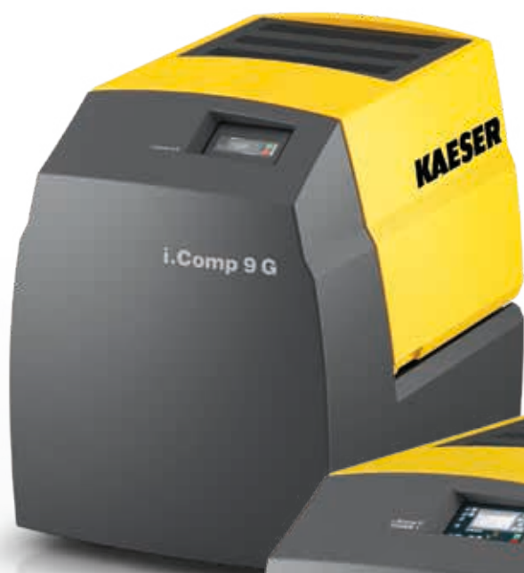
Fig. : i.Comp 9 G