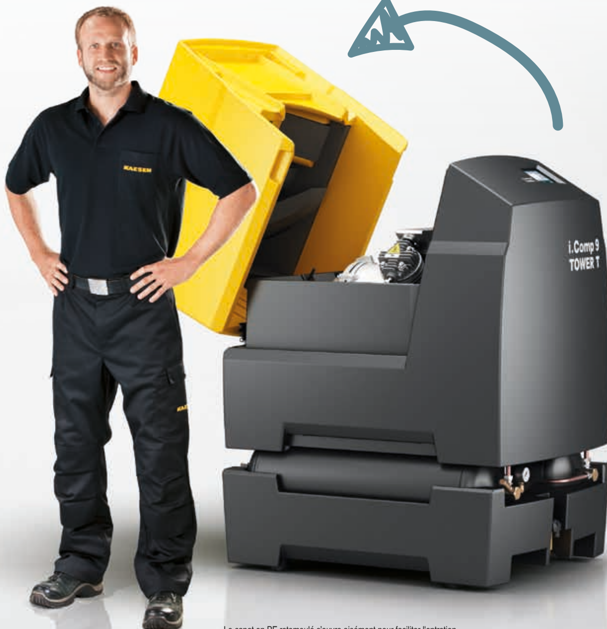
Le capot en PE rotomoulé s'ouvre aisément pour faciliter l'entretien.

Branchez et démarrez – la station d'air comprimé compacte et entièrement équipée nécessite simplement une alimentation électrique et un raccordement au réseau d'air comprimé. Elle ne demande pas d'autres travaux d'installation. L'efficacité énergétique, la facilité d'entretien, la longévité et l'harmonisation optimale de tous les composants garantissent de nombreuses années d'utilisation fiable et économique.