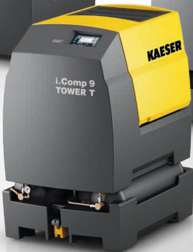
Fig. : i.Comp 9 TOWER T