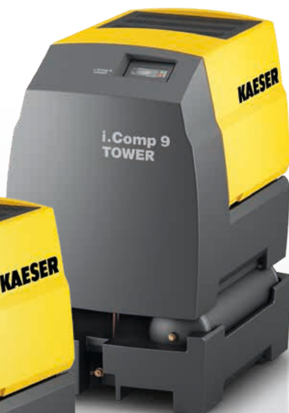
Fig. : i.Comp 9 TOWER