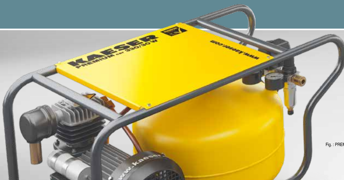
Fig. : PREMIUM CAR 330/30 W