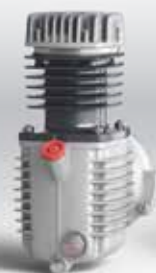
Bloc compresseur mono-cylindre