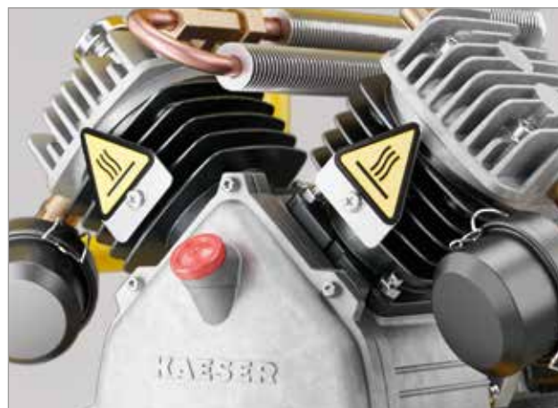
Fig. : Bloc compresseur KAESER de qualité