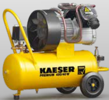
Fig. : PREMIUM 450/40 W