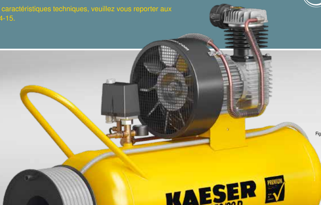
Fig. : PREMIUM 350/90 D