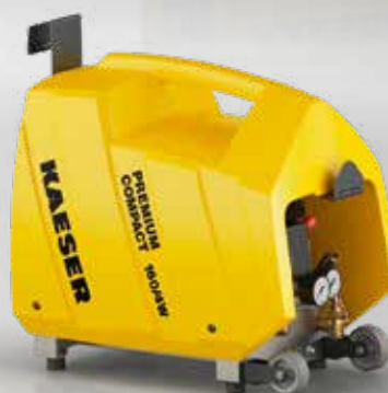
Fig. : PREMIUM COMPACT 160/4W