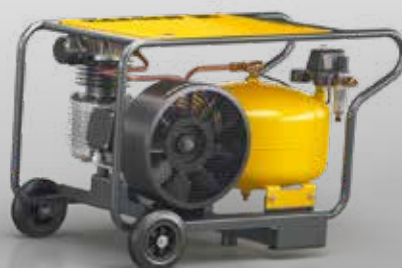
Fig. : PREMIUM CAR 350/30 W