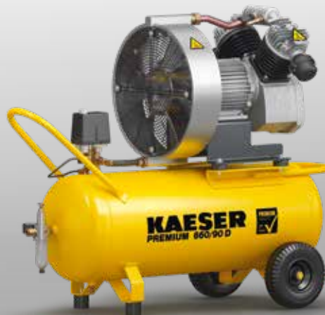
Fig. : PREMIUM 660/90 D