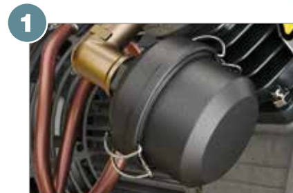
Filtre à air d'aspiration avec silencieux