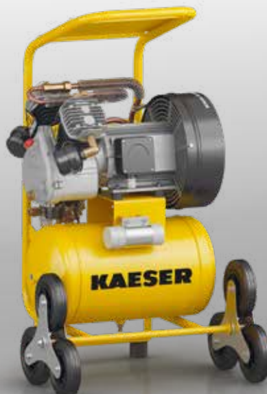
Fig. : PREMIUM COMPACT 450/30W