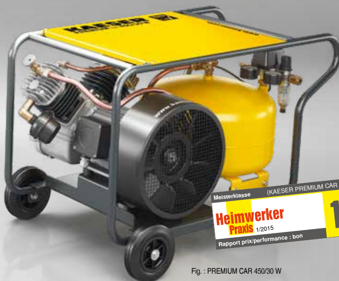
Fig. : PREMIUM CAR 450/30 W

Meisterklasse (KAESER PREMIUM CAR 450/30 W) Heimwerker Praxis 1/2015 Rapport prix/performance : bon 1,3