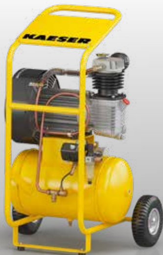
Fig. : PREMIUM COMPACT 350/30W