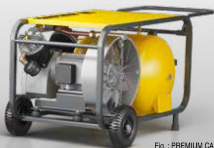
Fig. : PREMIUM CAR 660/70 D