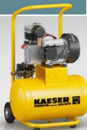
Fig. : PREMIUM COMPACT 250/30W