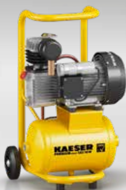
Fig. : PREMIUM SILENT 130/10W