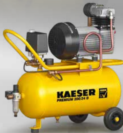
Fig. : PREMIUM 200/24 D