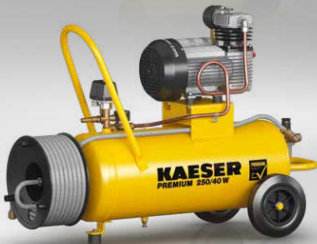
Fig. : PREMIUM 250/40 W