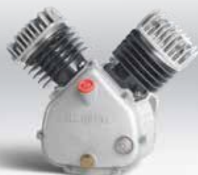
Bloc compresseur bi-cylindre