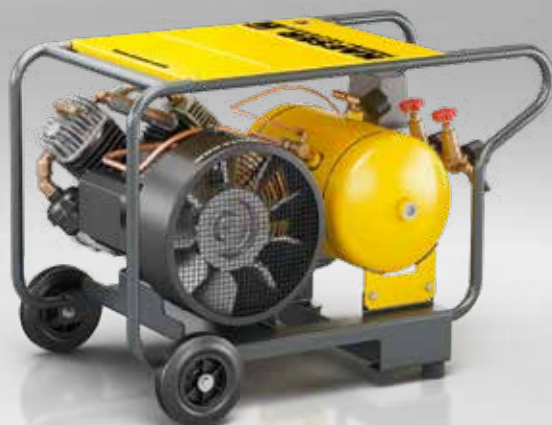
Fig. : PREMIUM CAR 150-2/16 W