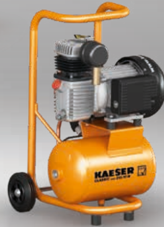
Fig. : CLASSIC mini 210/10 W