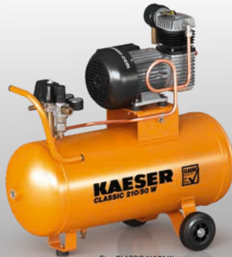
Fig. : CLASSIC 210/50 W