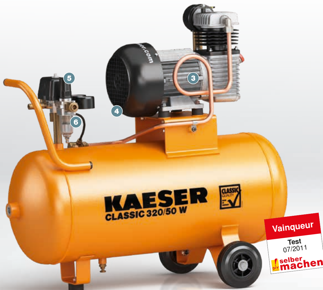
Fig. : CLASSIC 320/50 W