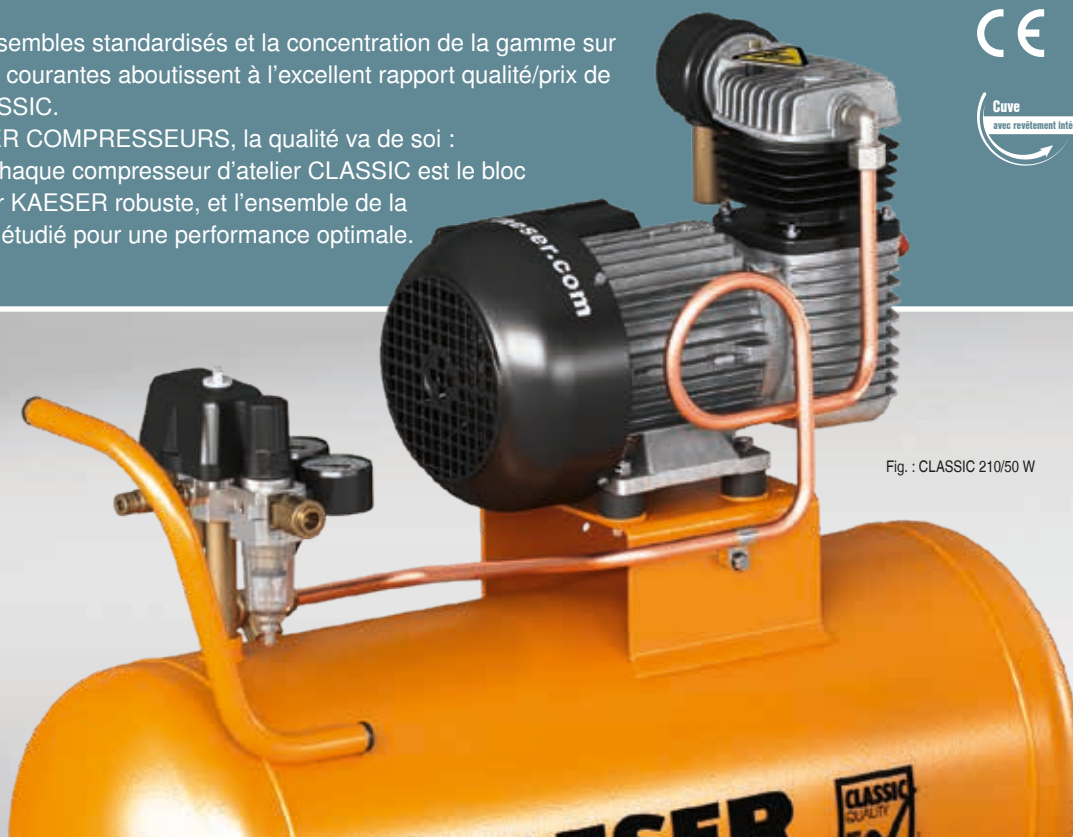
Fig. : CLASSIC 210/50 W