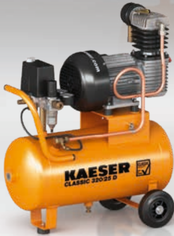
Fig. : CLASSIC 320/25 D